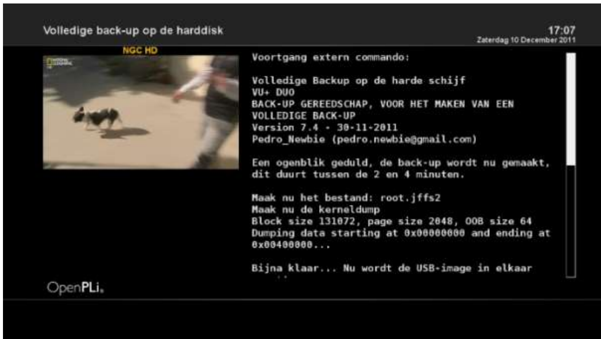
Scherf 2: verloop van het back-up proces op een VU+ Duo