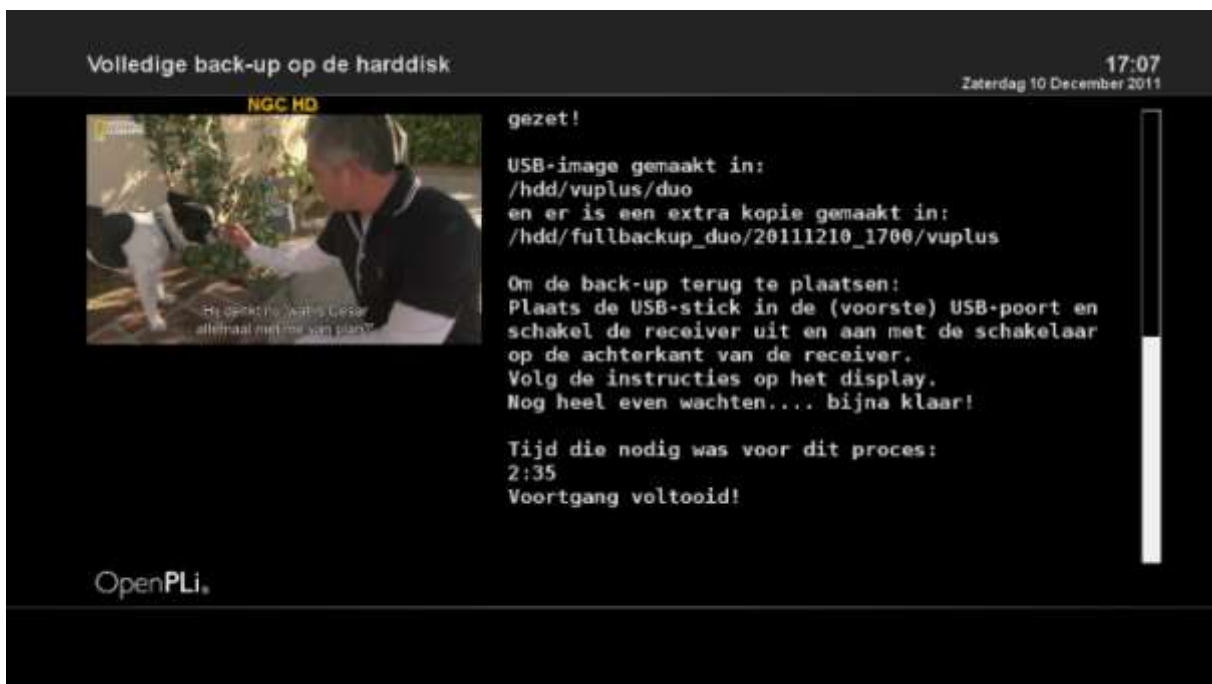
Scherf 3: verloop van het back-up proces en het einde op een VU+ Duo